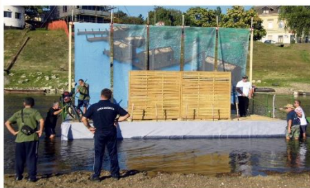
UDVDR-a RH Ogranak Sisak Klub Vrbina - Zlatna Victoria