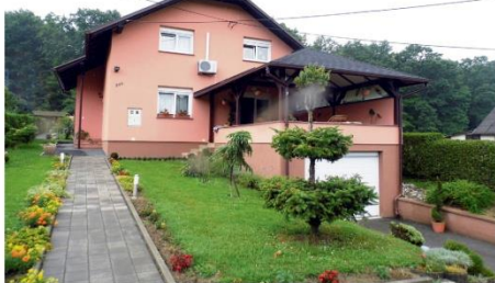
Obitelj Augustinović, Gornje Komarevo 36b - Srebrno priznanje

Posebno priznanje za izniman doprinos i potporu u realizaciji projekta "Keltska noć 2013" uručen je predstavnicima sponzora te pokrovitelja.