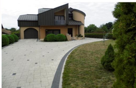
Obitelj Božić, Stupno 78 - Srebrno priznanje