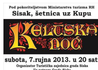
Telop Mreža TV